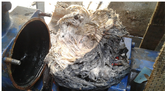
Imagens do Emissário de Águas Residuais da Ereira